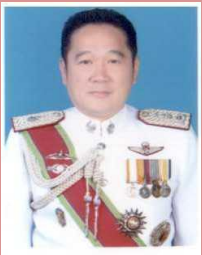
พล.ต.ต.วรเทพ เมธาวัชร รอง ผบช.สกบ.