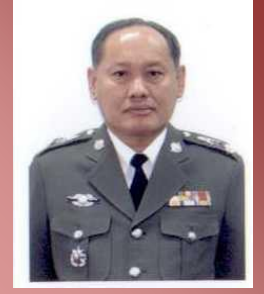
พล.ต.ต.สมาน สุดใจ ผบก.ยธ.

มีอำนาจหน้าที่เกี่ยวกับการพัสดุประเภทที่ดิน และสิ่งก่อสร้างของสำนักงานตำรวจแห่งชาติ ศึกษาพัฒนาและสร้างมาตรฐานรูปแบบรายการและราคากลางสิ่งก่อสร้างของสำนักงานตำรวจแห่งชาติ