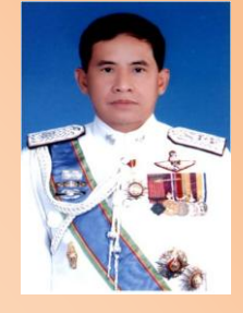
พล.ต.ต.ศักดิ์ฐ์ กิตติขจร ผบก.พท.

มีอำนาจหน้าที่เกี่ยวกับการพัสดุของสำนักงานผู้บัญชาการตำรวจแห่งชาติ และดำเนินการศึกษา ค้นคว้า พัฒนาและสร้างมาตรฐานคุณลักษณะเฉพาะครุภัณฑ์ของสำนักงานตำรวจแห่งชาติ