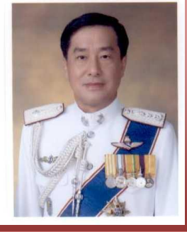
พล.ต.ท.ธีรยุทธ กิติวัฒน์ ผบช.สกบ.