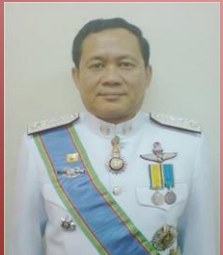
พล.ต.ต.สังกะ คุชหิรัญ รอง ผบช.สกบ.

สำนักงานส่งกำลังบำรุง เป็นหน่วยงานเทียบเท่ากองบัญชาการตามพระราชกฤษฎีกาแบ่งส่วนราชการ สำนักงานตำรวจแห่งชาติ พ.ศ.2552 มาตรา 4